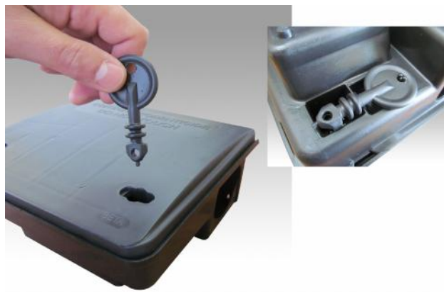
Eficiente sistema de doble cerradura