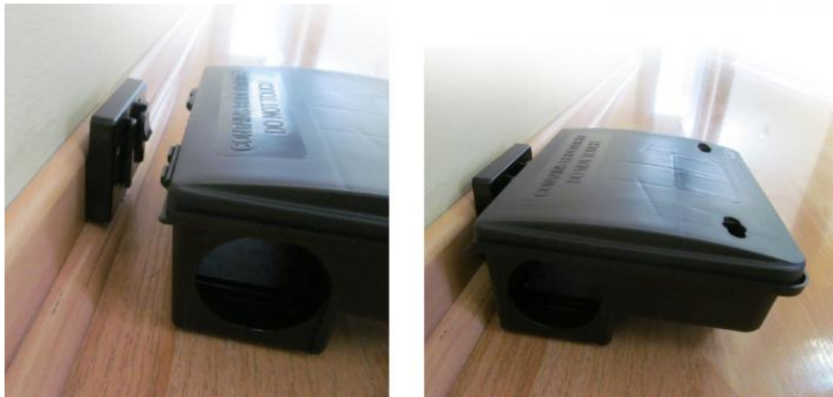
Sistema de anclaje para fijar la BTStation Starter a la pared

Este producto no es tóxico. No requiere registro.