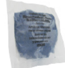
Cebo Blando (Soft Bait)