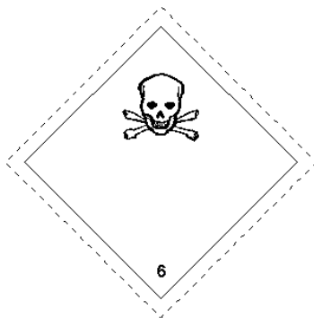
Rótulo Peligro Principal