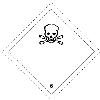
Rótulo Peligro Principal