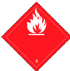
Rótulo Peligro Subsidiario