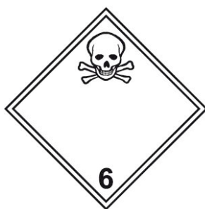
Rótulo Peligro Principal