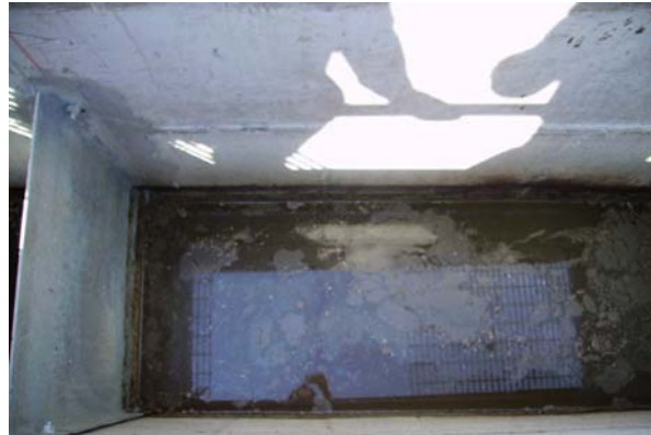
CAPA DE GRASA CON BIO FAT TABLETAS