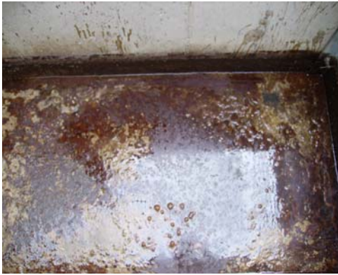
CAPA DE GRASA HABITUAL