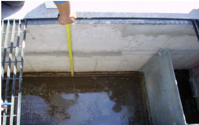
GROSOR DE LA CAPA DE GRASA, FINALIZADO EL TRATAMIENTO